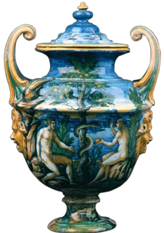
Bottega di Orazio Fontana, Vaso a duplice ansa . Maiolica. XVI sec., Loreto, Museo-Antico Tesoro della Santa Casa. (Quinta Sezione)