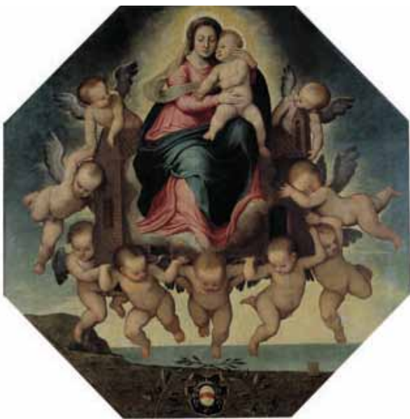
Francesco Menzocchi, Traslazione della Santa Casa . An. 1548, olio su tavola ottagonale, Loreto, Museo-Antico Tesoro della Santa Casa. (Seconda Sezione)