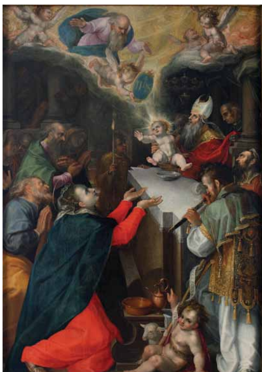
Filippo Bellini, Circoncisione di Gesù (già per la Cappella del Nome di Gesù). An. 1592, olio su tela, Loreto, Museo-Antico Tesoro della Santa Casa. (Terza Sezione)

19. Giuseppe M. Crespi, L'Immacolata , San Gaetano da Thiene con il Bambino Gesù. Olio su tela, Fin del sec. XVII, cm. 241h x 151 (senza cornice), 271h x 181 (con cornice). Loreto, Museo-Antico Tesoro della Santa Casa.