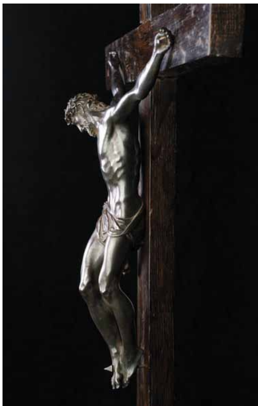
Giambologna (Jean de Boulogne), Crocifisso , An. 1573 ca., argento e legno, Loreto, Museo-Antico Tesoro della Santa Casa. (Quarta Sezione)

36. Laboratorio Fratelli Tavani, Rosa d'oro . Oro, argento e marmo. 2007, cm 43h x 9. Loreto, Museo-Antico Tesoro della Santa Casa.