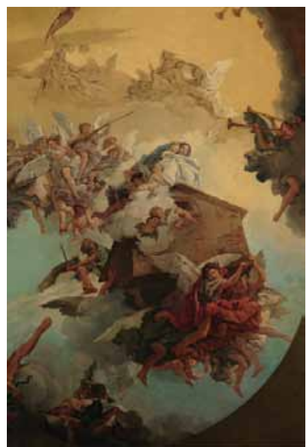
Mariano Fortuny (attr.), Traslazione della Santa Casa . Sec. XX (post 1915), olio su tela, Loreto, Museo-Antico Tesoro della Santa Casa. (Seconda Sezione)