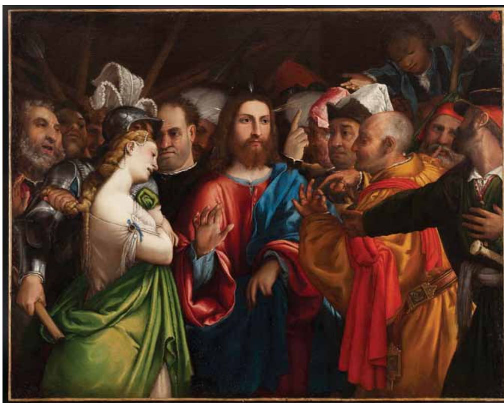
Lorenzo Lotto, Cristo e l'adultera . Olio su tela, 1540 ca, Loreto, Museo-Antico Tesoro della Santa Casa. (Prima Sezione)