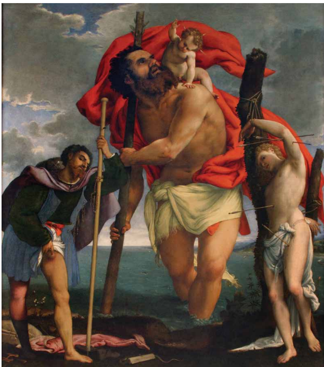
Lorenzo Lotto, San Cristoforo con il Bambino Gesù e i santi Rocco e Sebastiano. Olio su tela, 1532-1533 ca., Loreto, Museo-Antico Tesoro della Santa Casa. (Prima Sezione)