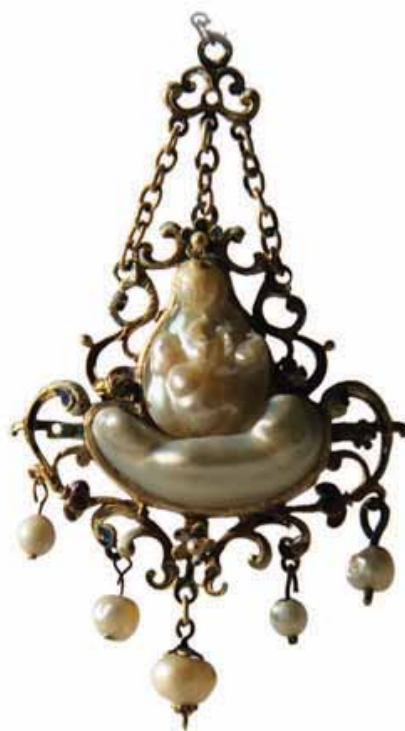
Pendente con Perla orientale grande e 5 piccole. Oro e perle. Sec. XVII, Loreto, Museo-Antico Tesoro della Santa Casa. (Quarta Sezione)